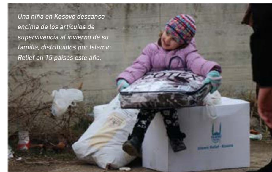
Una niña en Kosovo descansa encima de los artículos de supervivencia al invierno de su familia, distribuidos por Islamic Relief en 15 países este año.

Islamic Relief ha proporcionado apoyo humanitario y de desarrollo en los Balcanes desde 1990. Durante el período de paz y crecimiento de esta región, hemos podido ver cómo donantes locales colaboran con las organizaciones que en su día les ayudaron cuando ellos lo necesitaban.