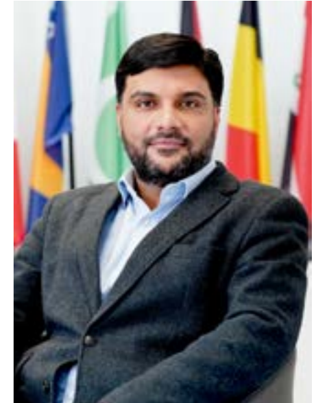
Waseem Ahmad Director Ejecutivo, Islamic Relief Worldwide

Al presentaros este informe, soy muy consciente de que la crisis de la Covid-19 aún no ha terminado, como tampoco lo ha hecho el sufrimiento causado por la crisis que comenzó tiempo atrás, mucho antes de que el virus demandara la atención mundial. El año 2021 marca el