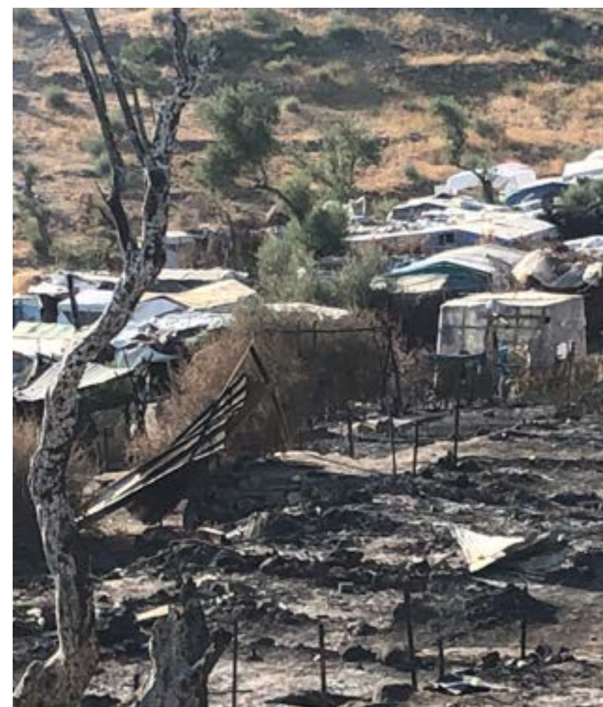
Los incendios del Centro de Recepción e Identificación dejan a miles de personas sin refugio.

DISASTRE: Tras varios meses de cuarentena por el coronavirus, una serie de incendios en el campamento de refugiados más grande de Europa obligan a 10.000 personas a dormir a la intemperie en Grecia.