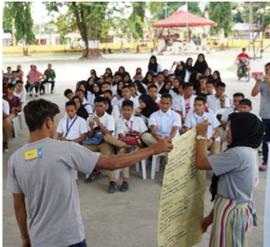
Antes de las restricciones de distanciamiento social de Covid-19, los jóvenes en el campamento de paz crean mensajes de paz para ayudar a resolver conflictos, generar confianza entre personas de diferentes religiones y abordar narrativas estigmatizantes.

cada vez que hay un rumor sobre conflictos y la situación de seguridad, y comparto solo la información correcta. Usamos las redes sociales y los mensajes de texto para minimizar el miedo de nuestros familiares y amigos y guiarlos”.