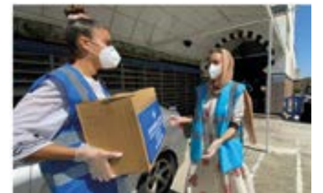
Voluntarios llevan paquetes de alimentos de Islamic Relief a uno de nuestros puntos de distribución, la mezquita de Al-Fath en Leganés, Madrid.

comprometidos se han unido para asistir a la campaña de juguetes “Even a Smile”, colaborando con el hospital infantil de Crumlin en Dublín. Recaudaron más de 500 juguetes que entregaron a los niños del hospital para sacarles una sonrisa durante tiempos difíciles.